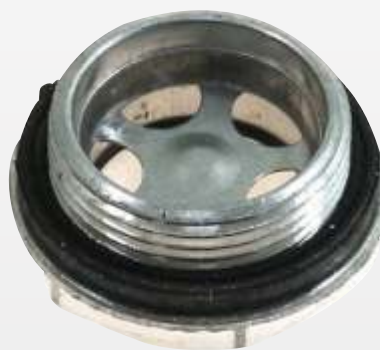
VISOR SG S / A